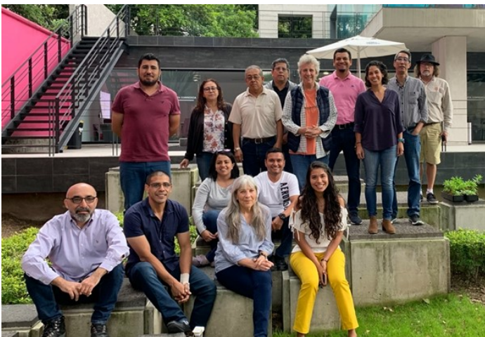
Capacitación técnica para autoridades pesqueras centrada en la programación R, verano de 2019.

El objetivo de FishPath es buscar soluciones para abordar y atender las barreras sistémicas que impiden a la pesquería de escama lograr un manejo pesquero efectivo que contribuya a la sostenibilidad. Estas barreras son compartidas entre otras pesquerías de pequeña escala y por lo tanto, el proceso se puede replicar con otros recursos.